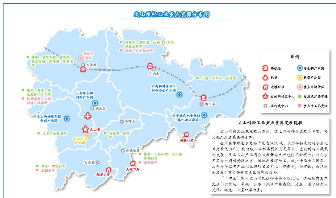
图 1 文山州轻工业重点资源分布图